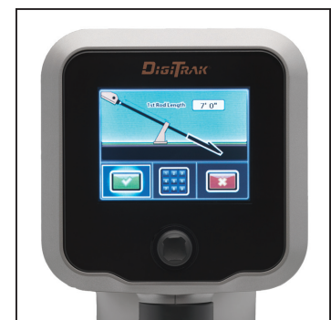
DataLog® LWD™ Set-Up Anzeige

Das F5® System ist kompatibel mit dem TensiTrak® Zugkraft- und Spülungsdruck-Kontrollsystem von DCI. Außerdem können Sie mit dem F5® System beim Bohren den Spülungsdruck in Echtzeit anzeigen.